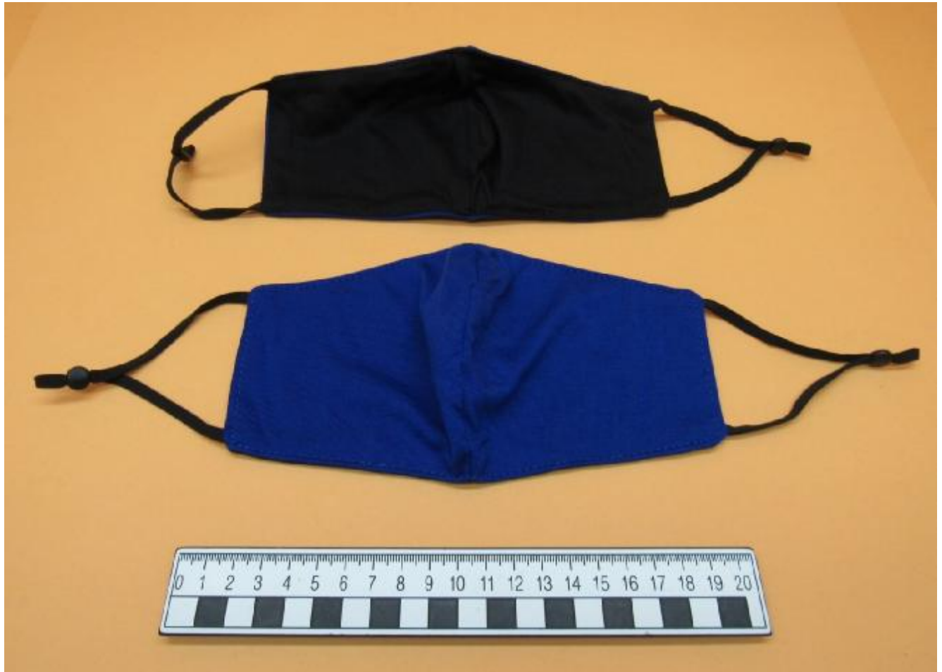
Mascarilla higiéncia reutilizable ref. 6646